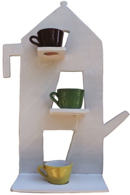
TOTO MASSARO, Tre per te, 2013, ceramica, cm 49,5 x 28,5 x 18,5