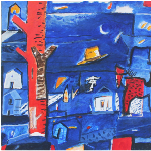
TOTO MASSARO, Vento scomposto, 2012, acrilico, acquarelle e matita su carta, cm 70 x 70