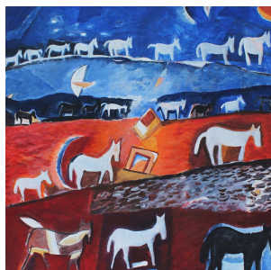
TOTO MASSARO, Esodo, 2011, acrilico su tela, cm 90 x 90

l'emozione delle immagini, il calore delle terrecotte